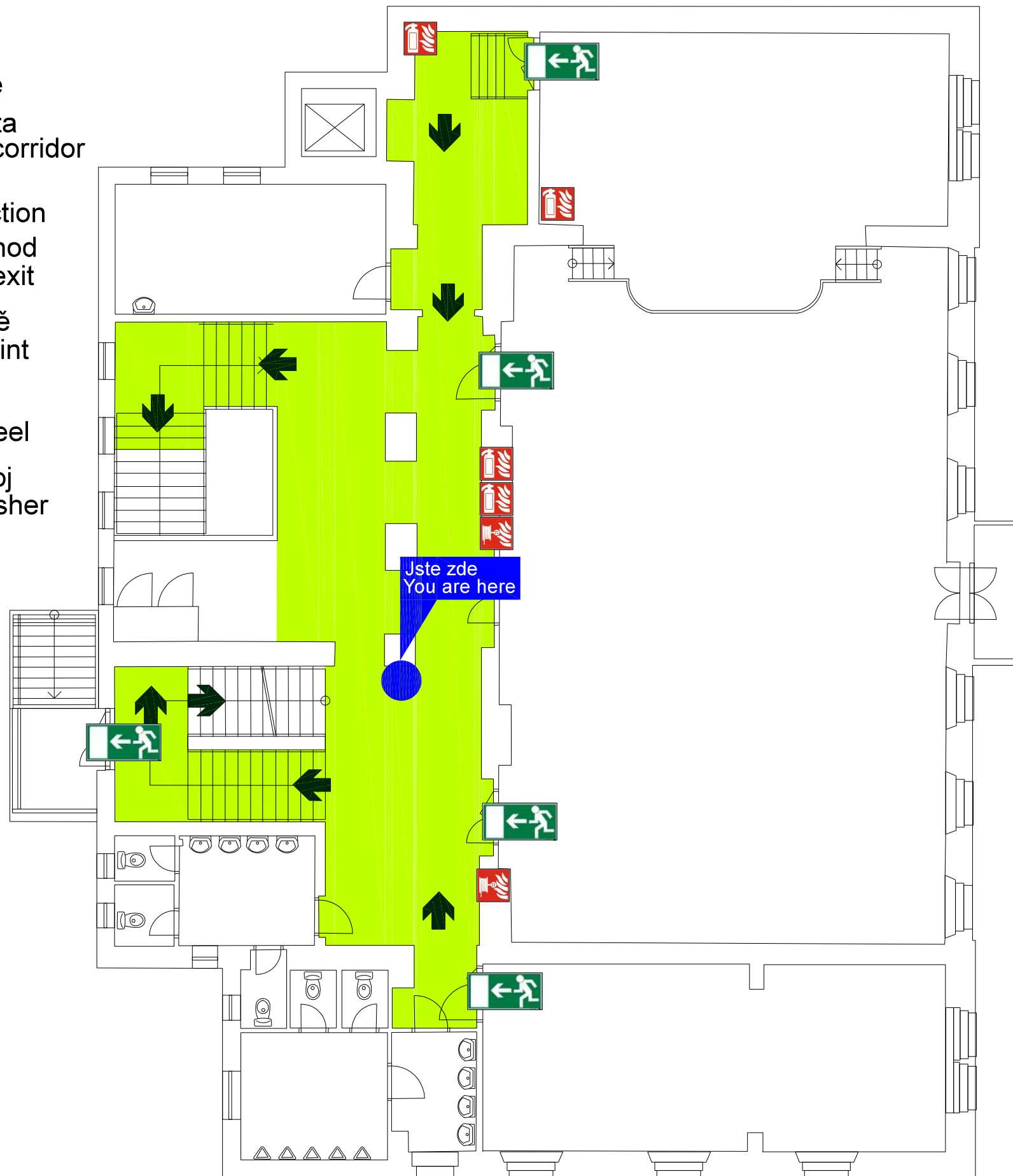
PŘEHLEDOVÝ PLÁN GENERAL PLAN